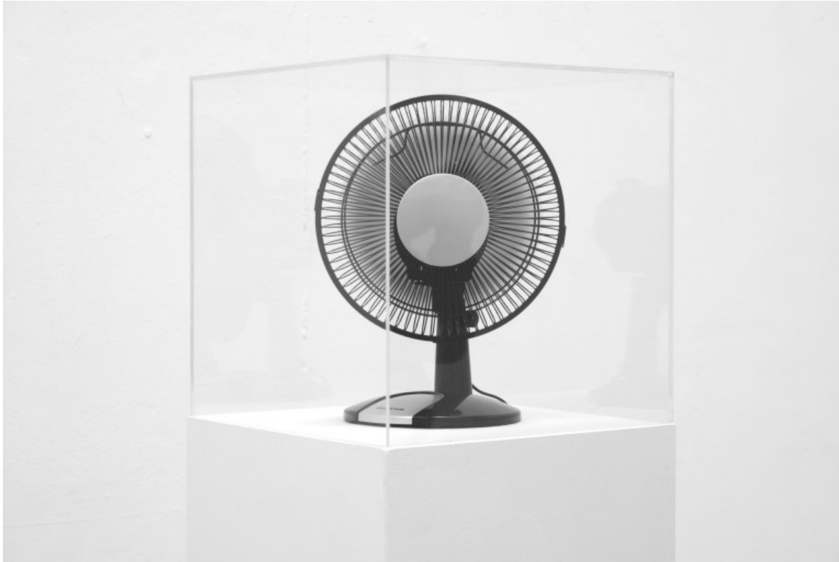
IMO Projects, Copenhagen 2014 Ventilateur, cloche plexiglas, taille variable.